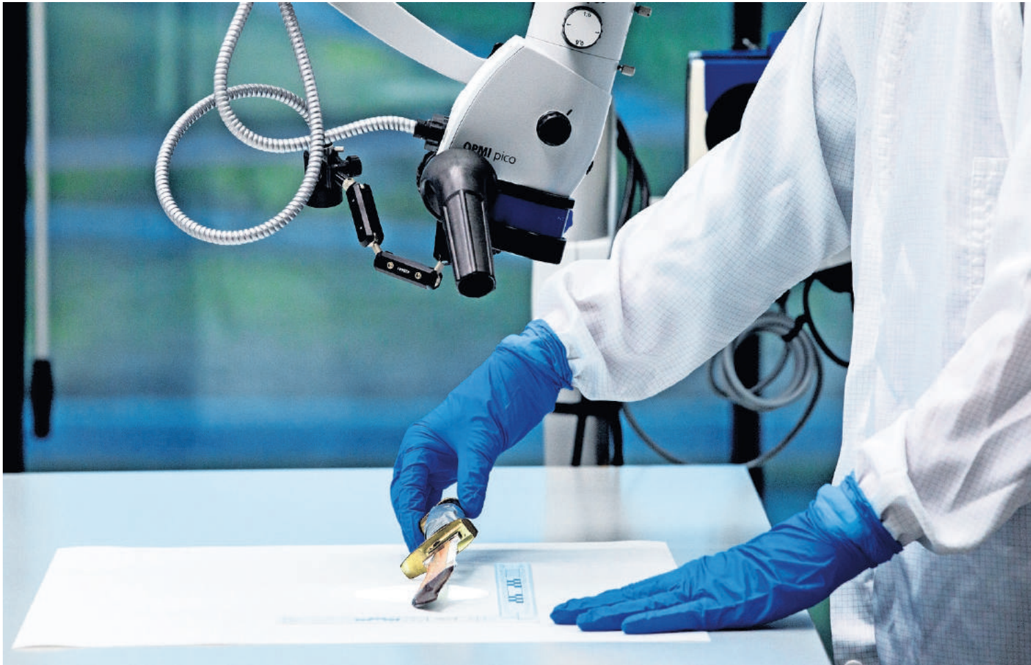
Veilig stellen van DNA-materiaal is de eerste fase van sporenonderzoek bij het NFI.